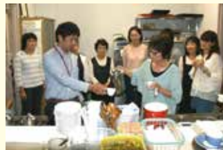
コーヒー講習会でプロの技を学ぶ親の会会員

また、近隣市町の親の会と交流をはかり、研修や情報交換を行いながら、会員の資質向上に努めています。