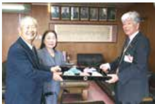
交通安全グッズ寄贈で町長を表敬訪問