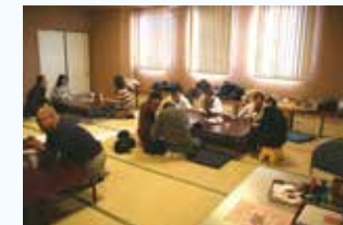
フリースペース『れんげそう』